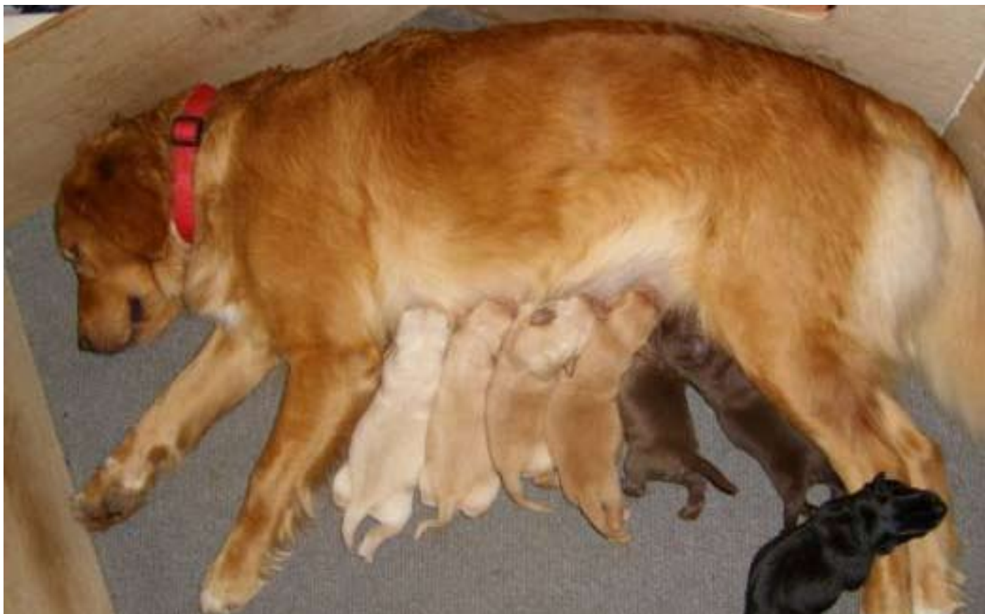
Charlie (nr. 3 fra venstre) sammen med sin mor og søskende kun 1 uge gammel.