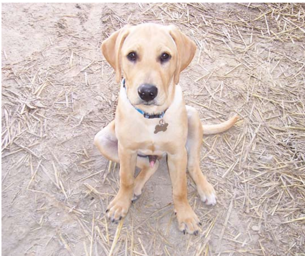
Så er han med i stalden. Han var ikke så klog på heste til at starte med, men har efterhånden fået lært, at det er bedst at flytte sig, når de kommer for tæt på.