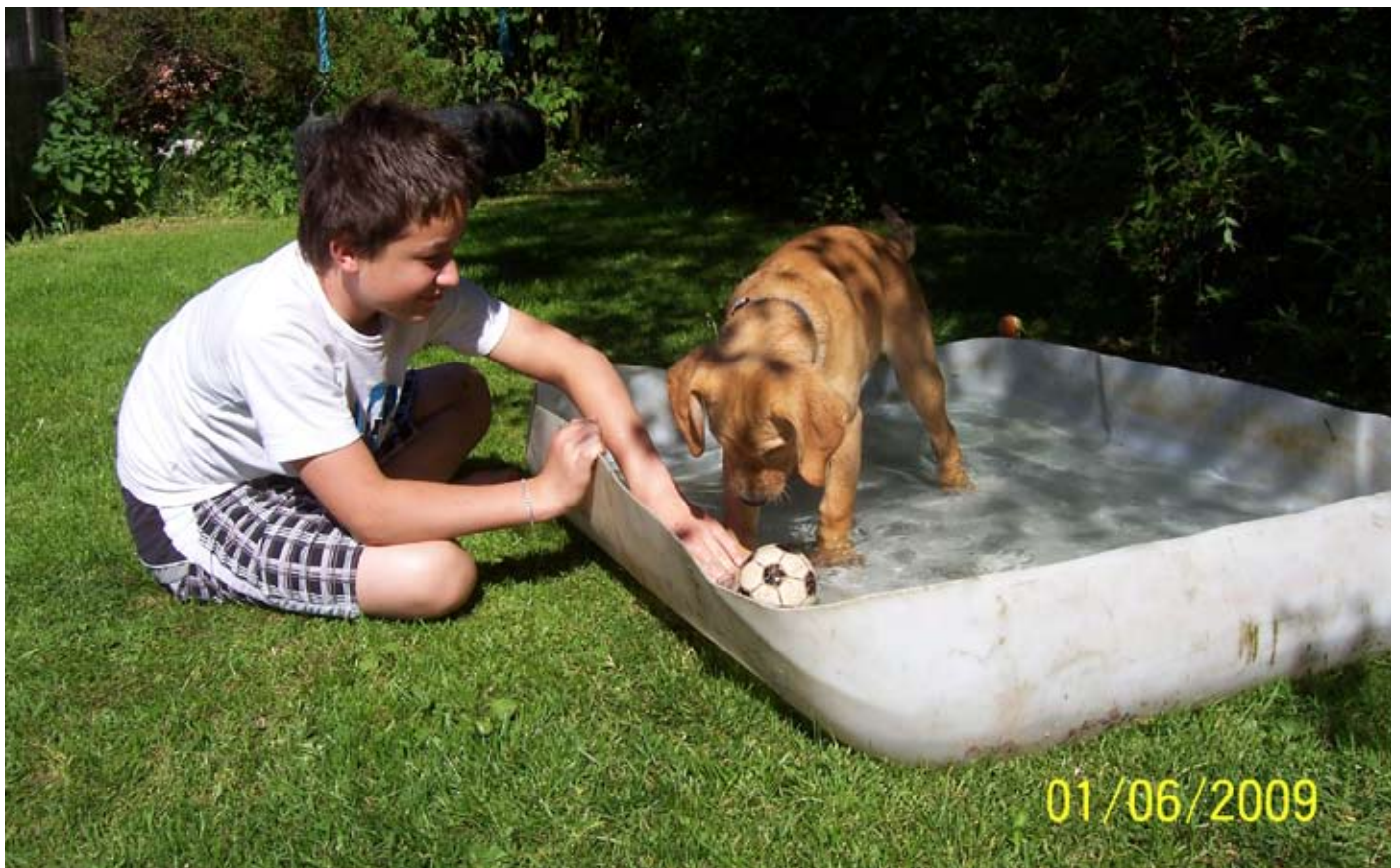
I de varme dage er det rart med et soppebassin.