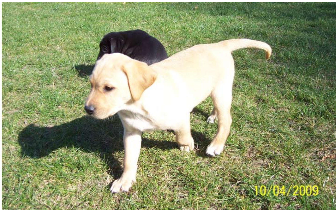
7 uger gammel og sååå sød.