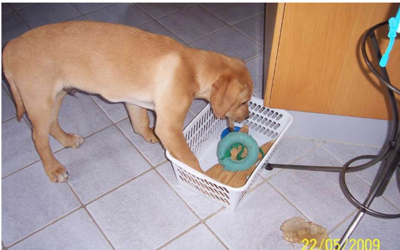
Han er et rigtig legebarn og henter gerne noget fra kurven.