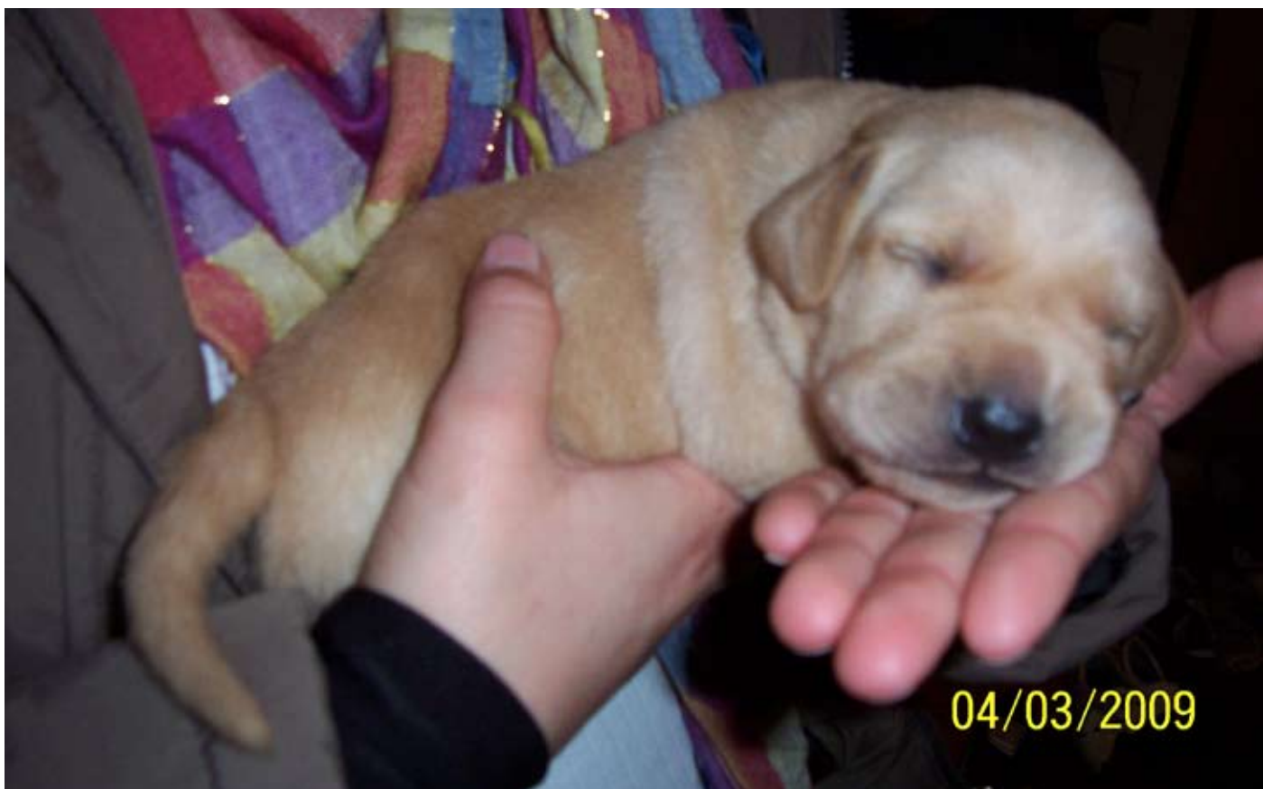
Charlie 10 dage gammel. Første gang vi så ham og faldt pladask for ham.