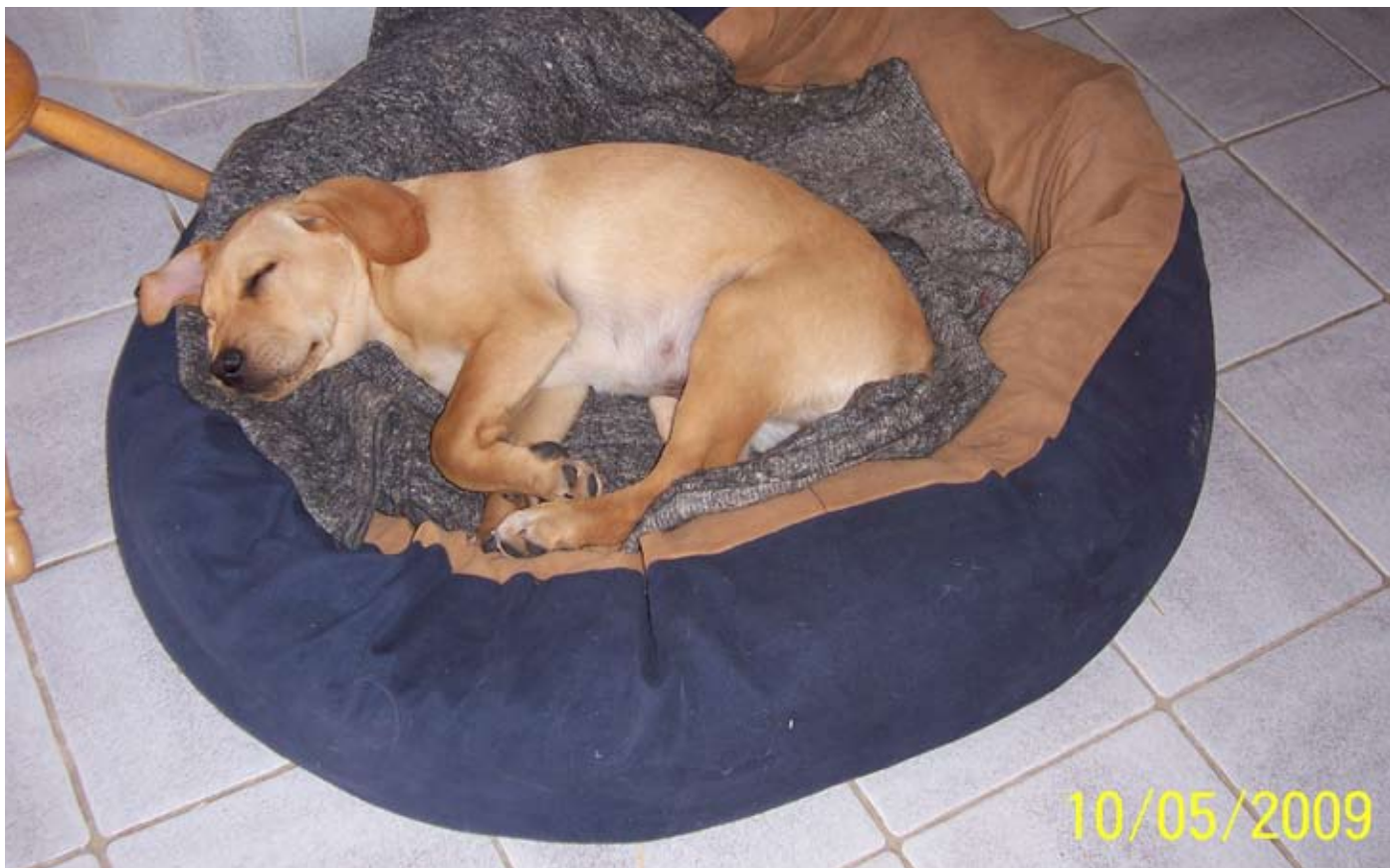
Endelig efter en hektisk uge med tre konfirmationer, kunne vi hente ham. Det varede ikke længe før kurven blev hans faste holdepunkt.